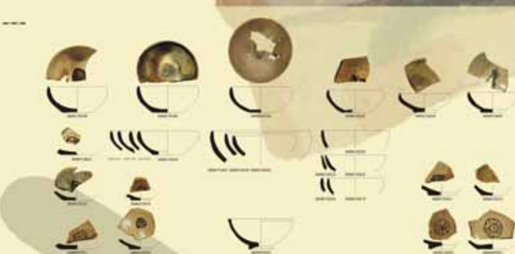
Principales formas de la serie escudilla

Estas producciones han tenido una amplia difusión, por lo que se encuentran numerosos paralelos en las comarcas barcelonesas y en otros puntos del Mediterráneo occidental. La servidora con decoración floral (ramas de pino), por ejemplo, es una pieza bien conocida que tiene paralelos en muchos yacimientos cercanos (Palau de la Generalitat - Barcelona, El Bullidor, M. del Reval - Martorell, Llinars del Vallès, Manresa) pero también aparece en enclaves mucho más alejados como Colliure o Rougers. Algo similar ocurre, también, con otras formas y decoraciones, aunque en este caso tal vez convenga señalar el papel desarrollado por las piezas más humildes. Por último, debemos destacar que esta producción cerámica, así como los restantes elementos arqueológicos que les acompañan, pueden situarse cronológicamente en una secuencia cercana a mediados del siglo XIV.