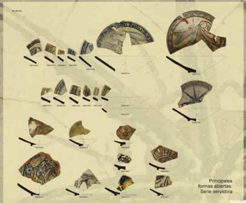
Principales formas abiertas: Serie servidora

Algo más de la mitad de esta muestra de pieza barcelonesa fue recuperada en los niveles de amortización (UEs. 1139-1202) de un pozo ciego, de planta cuadrada, localizado en las inmediaciones de la Foneria. Este conjunto, que abarca más de un centenar de piezas, representa una muestra unitaria de cerámicas de mesa con predominio de formas decoradas en verde y manganeso o con cubierta monocroma blanca, que aparecen acompañadas por un reducido número de escudilla decoradas en azul (inferior al 15%). El resto de las formas, entre las que se encuentran las piezas mejor omadas, proceden de los niveles de uso del Casal gótico de la calle Fonollers.