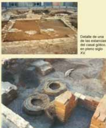
Foneria. Área de fundición con numerosas fisas y diversos moldes de campana, s. XVIII.