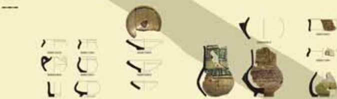
Otras formas: Especieros, piñers y piezas de pequeño formato.